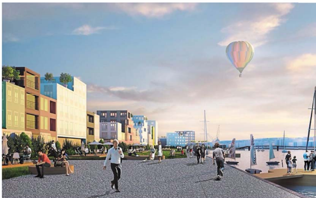
Voici comment le long des quais pourrait être aménagé. Le viaduc de Calix se situe derrière celui qui prend la photo.

Il est aussi question de développer des activités nautiques et sportives, avec des quartiers pour piétons où les voitures pourraient circuler, mais à 20 ou 30 km/h. Les transports en commun y seraient aussi très présents. Avec des navettes minibus et pourquoi pas des transports en bateaux. « Pourquoi ne pas envisager aussi de ramener le tram sur le quai ? Rien n'est arrêté. Il s'agira